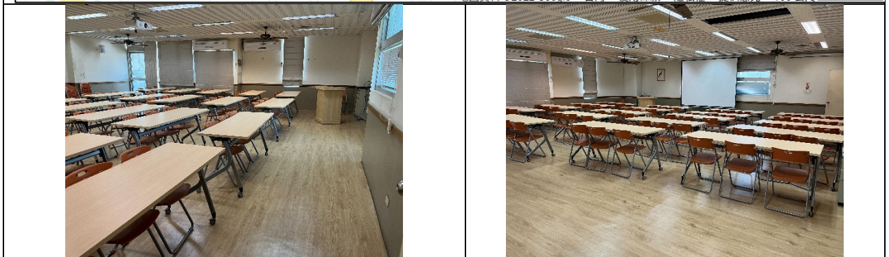
圖 1 嘉義市再耕園位置及 201 教室場地現況圖