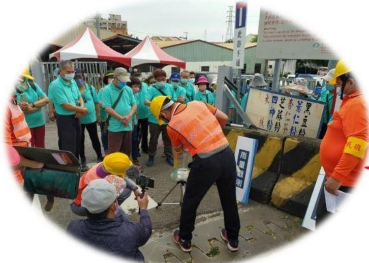
1110416-中埔鄉和興社區至台中市太平區中興社區觀摩實兵演練

依社區特性與需求，安排合適防救災活動；同時考量推動所需時程、預算與預期成果，整理成日後可以執行之社區防救災計畫。